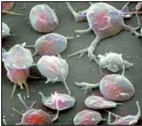
کپسول‌های حاوی فاکتورهای رشد در پلاکت